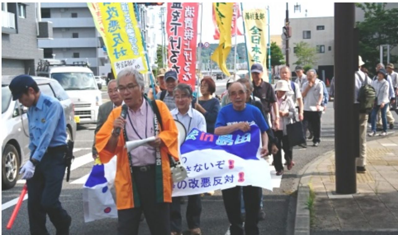
「静岡県高齢者大会in島田」大会終了後、JR島田駅周辺を行進（記事=P3〜）